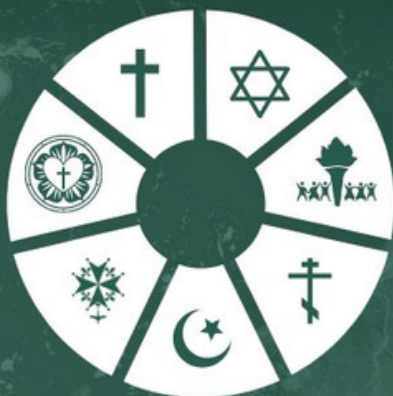
Table RONDE JEUDI 18 AVRIL 20H00